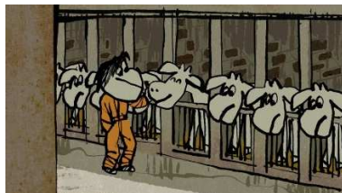
(La Générale du veau - Franck Guillou)

Sur ces huit courts métrages, la moitié sont des premiers films. Ce choix illustre bien notre volonté de découverte de nouveaux talents, de recherche et d'innovation.