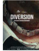
Diversión Fiction, 2018, 22'

Anaïs Bertrand fonde Insolence Productions en 2012 avec la volonté de produire des films à la lisière, où le fantastique, la science-fiction ou même l'horreur font des incursions sans pour autant répondre à tous les codes du Cinéma dit de Genre. Bien au-delà de leur étrangeté, ces projets sont avant tout des films d'auteurs abordant des thèmes universels. Au gré des rencontres, nous avons aussi choisi d'accompagner des auteurs aux sensibilités plus "classiques" tout en gardant comme ligne de révéler des metteurs en scène aux univers visuels affirmés portant des histoires fortes.