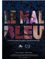
Le Mal bleu Fiction, 2018, 15'